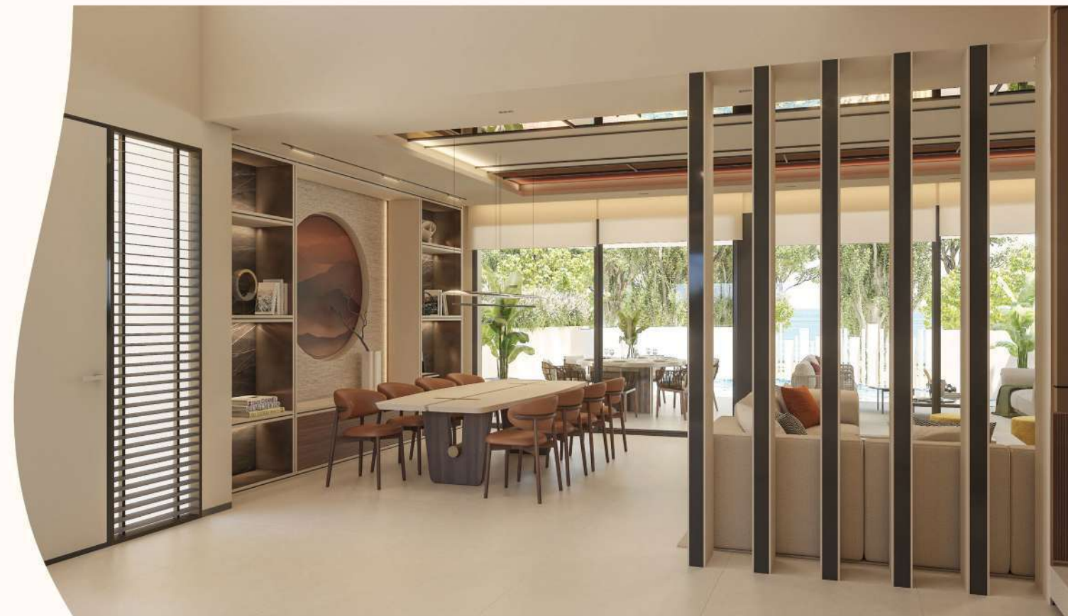
Living Room & dining area