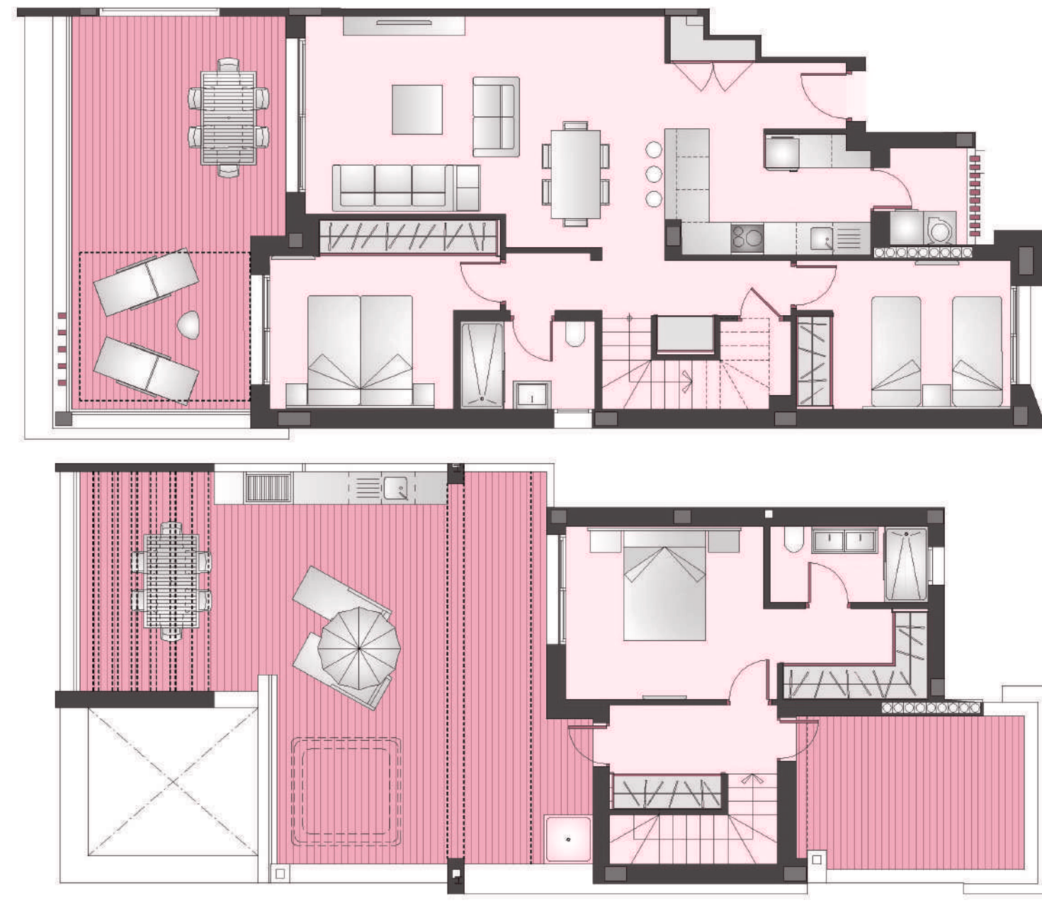
Apartamento 3 dormitorios + 2 Baños + Solarium Apartment 3 Bedroom + 2 Bathroom + Sun Terrace