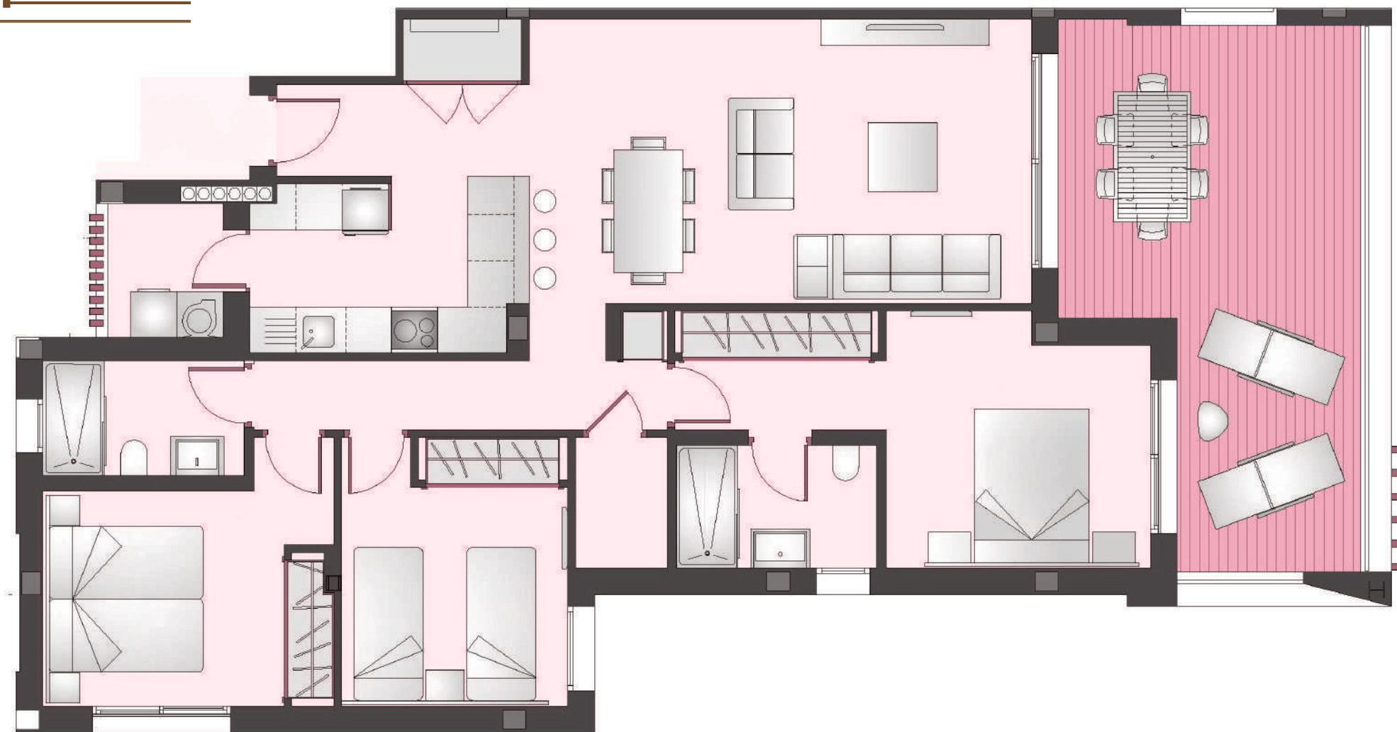
Apartamento 3 dormitorios + 2 Baños Apartment 3 Bedroom + 2 Bathroom.