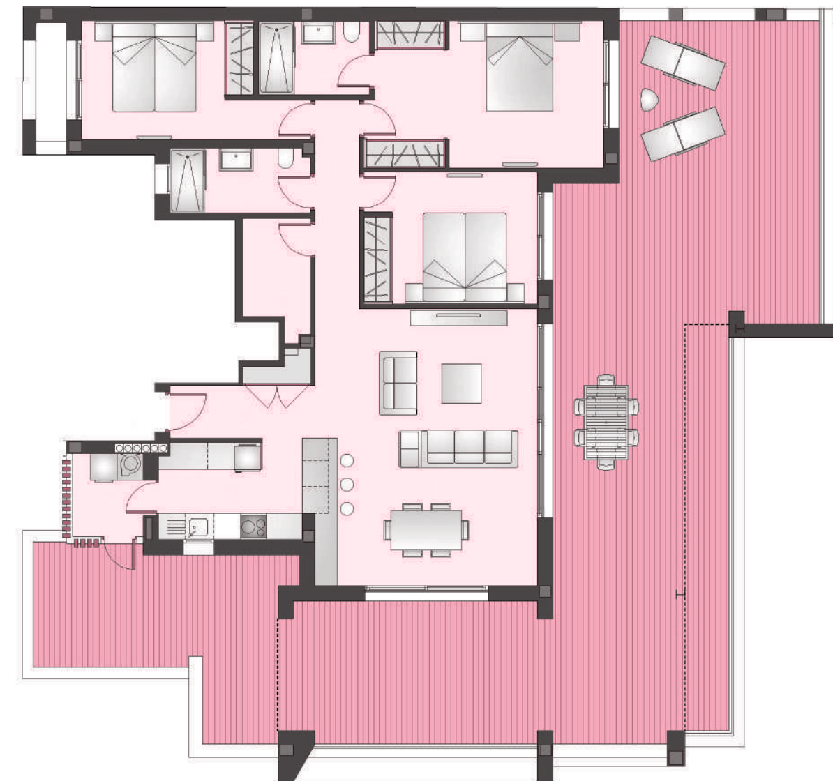
Apartamento 3 dormitorios + 3 Baños Apartment 3 Bedroom + 3 Bathroom.

Plano comercial sin valor contractual sujeto a posibles modificaciones por razones o exigencias de índole técnica o jurídica. Las superficies son aproximadas. Cocina y amueblamiento orientativo sin valor contractual. Commercial plan without contractual value subject to possible modifications for technical or legal reasons. Measurements shown are approximate. Kitchen and furnishing are for display purposes only, with no contractual value.