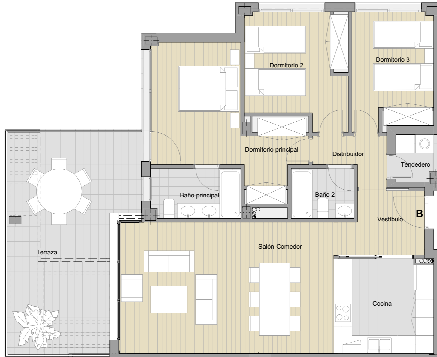
Nivel 4 (+3.00)