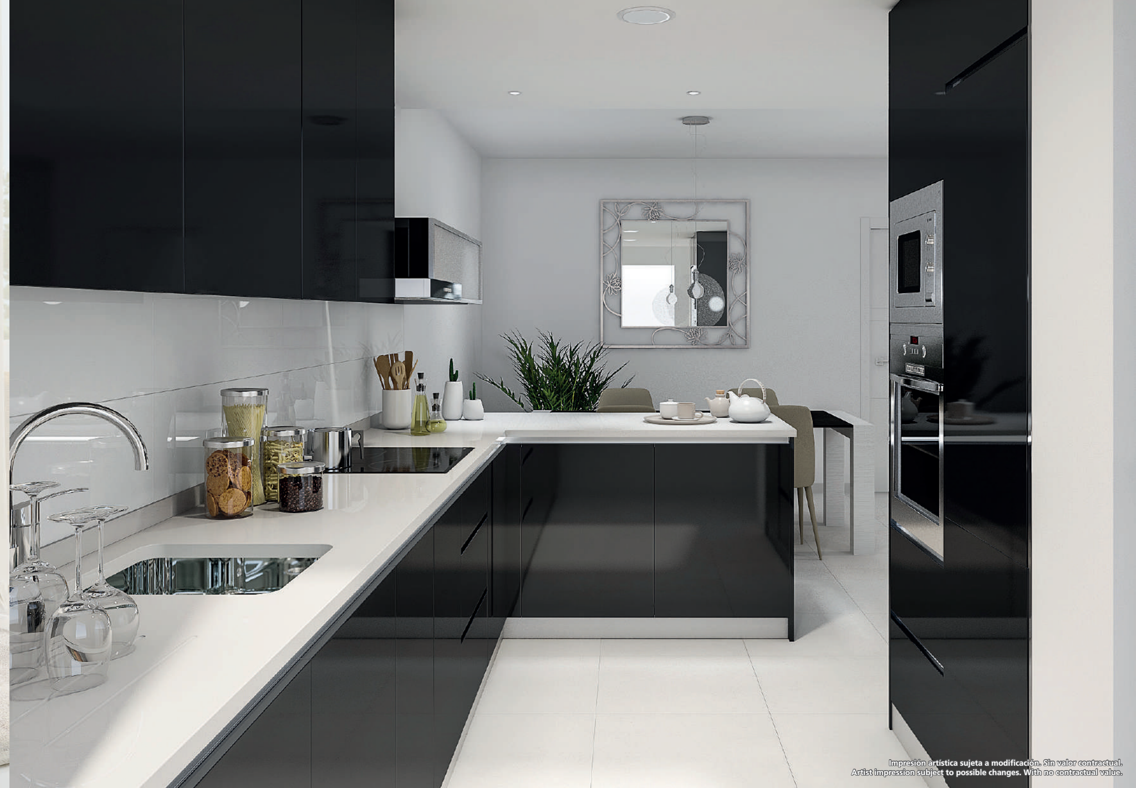
Impresión artística sujeta a modificación. Sin valor contractual. Artist impression subject to possible changes. With no contractual value.