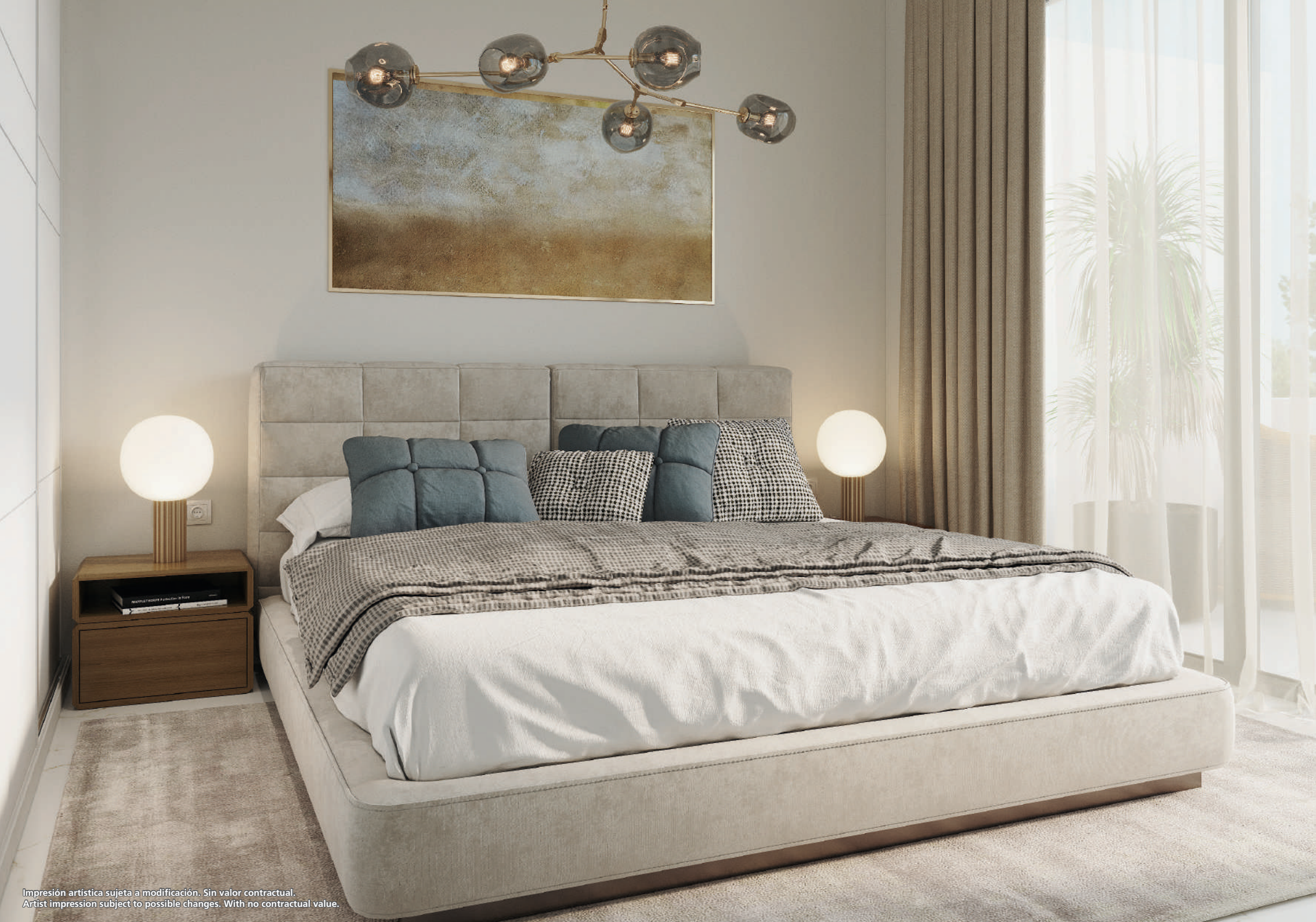
Impresión artística sujeta a modificación. Sin valor contractual. Artist impression subject to possible changes. With no contractual value.