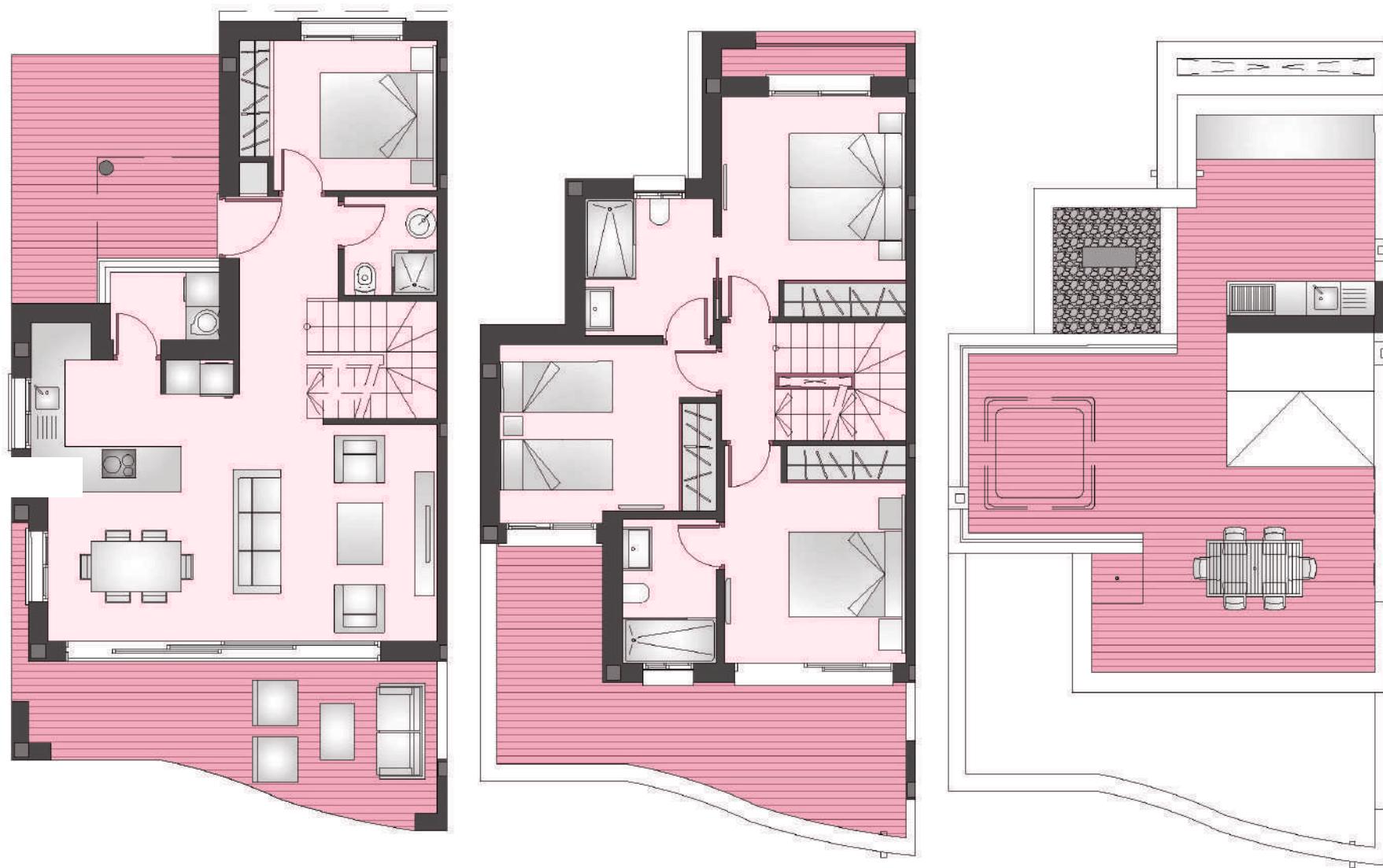
Vivienda 4 dormitorios + 2 Baños Home 4 Bedroom + 2 Bathroom.

Plano comercial sin valor contractual sujeto a posibles modificaciones por razones o exigencias de índole técnica o jurídica. Las superficies son aproximadas. Cocina y amueblamiento orientativo sin valor contractual. Commercial plan without contractual value subject to possible modifications for technical or legal reasons. Measurements shown are approximate. Kitchen and furnishing are for display purposes only, with no contractual value.