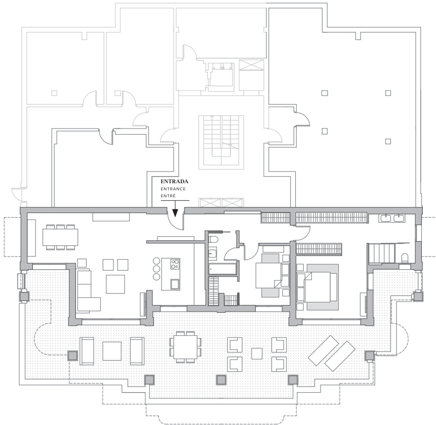
PLANTA JARDÍN | GARDEN FLOOR | MARK PLAN